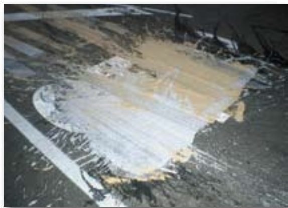
CAN PALAU, NOVEMBRE 2005