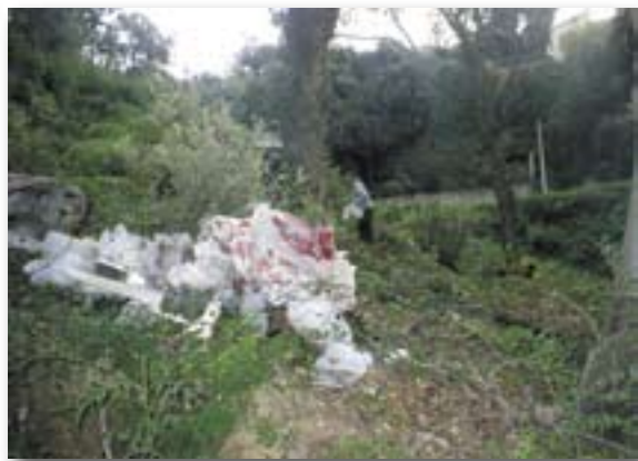
CASTELLAR D'ÍNDIES, OCTUBRE 2005

A tall d'exemple, adjuntem un parell de fotografies que mostren fins a quin punt l'incivisme i el vandalisme són presents a casa nostra.